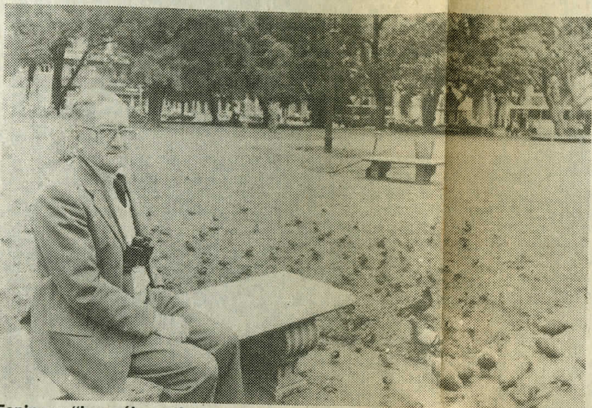
Feninger: "Los pájaros tienen sus plazas preferidas"

Loable y curiosa tarea de un estudioso de las aves urbanas